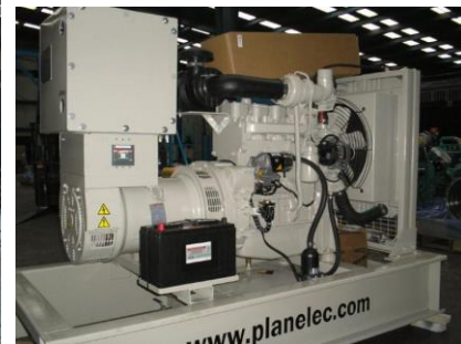
Detalle de componentes