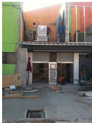
Cuarto de maquinas reducido